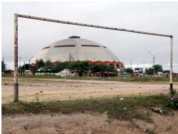
Imagem 02: “O Meninão”: opção de lazer para muitos bairros da cidade